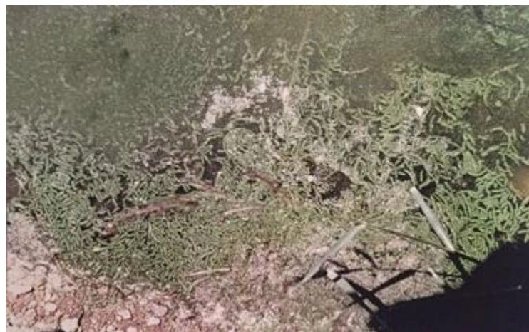
شکل ۲- پلت های دفعی ماهی فیتوفاگ حاوی مواد مغذی

پلت های غذایی حاوی ۷۰ درصد مواد غذایی هضم نشده سفره غذایی گسترده ای را فراهم آورده (شکل ۲) و ماهی کپور معمولی هم به عنوان مصرف کننده